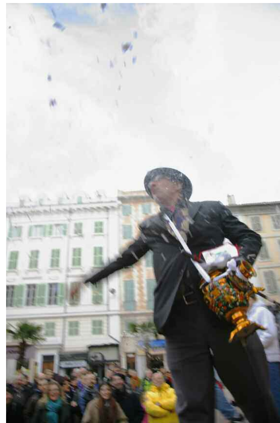
Cie Pile poil "Souvenirs assassins" mercredi 4 février 2009

Sirènes et midi net, une production de Lieux publics avec l'aide de la Sacem L'Opéra de Marseille s'associe à Sirènes et midi net et apporte à Lieux publics un soutien technique et logistique.